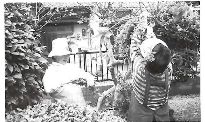
協力会員による草とりサービスの提供

一人暮らしの高齢者の方々からは「高い所の掃除ができない」「電球の交換ができない」など、日常生活における様々な困りごとの相談が寄せられています。このような困りごとに対応していくためには、この事業の趣旨を理解していただいた協力会員の方々を増やしていくことが、必要となってきます。現在、協力会員に登録している方は、「特別な資格や技術はもっていないけど、空き時間を利用して少しでも地域の方の役に立てたら」という方がほとんどです。ご自身の経験や特技を活かして協力会員に登録してみませんか。関心のある方は、お気軽に下記までご連絡ください。