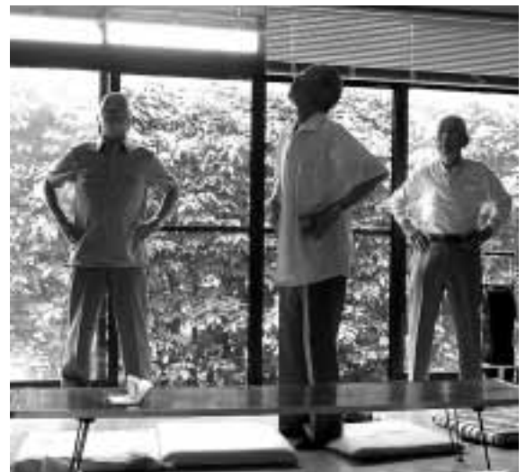
健康体操をするサロン参加者