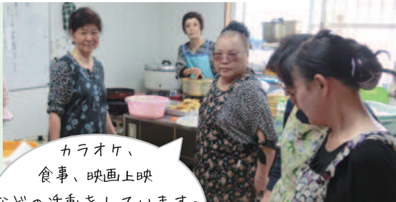
鴨生町いきいきサロン

カラオケ、 食事、映画上映 などの活動をしています。 みんなでおしゃべりして 楽しんでいます。