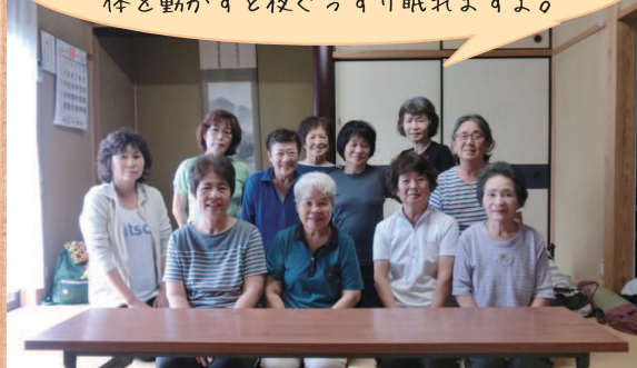
いきいきサロン一葉会 (口春地区)

転倒防止や体づくりの ために健康体操をしています。気持ちよく 体を動かすと夜ぐっすり眠れますよ。