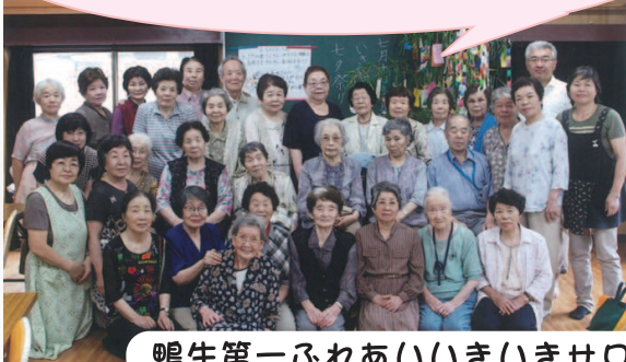
鴨生第一ふれあいいきいきサロン

楽しいおしゃべり、 おいしい食事と笑顔の絶えないサロンです。 出前講座などもあります。