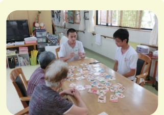
一緒にかるた遊びをして 盛り上がりました

限られた時間でしたが、今回の体験が今後につながるよう、これからもみなさんの活動を応援していきたいと思ひます。