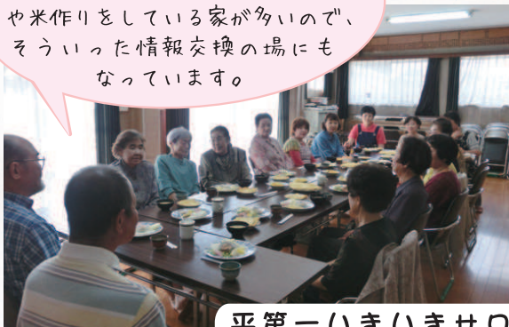
平第一いきいきサロン

おいしい食事をしながら、 楽しくおしゃべりしています。野菜 や米作りをしている家が多いので、 そういった情報交換の場にも なっています。