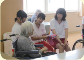
利用者の方と色々なお話をしました