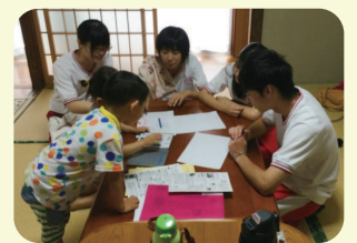
子育て情報紙づくりでは、 子ども達と仲良くなりました