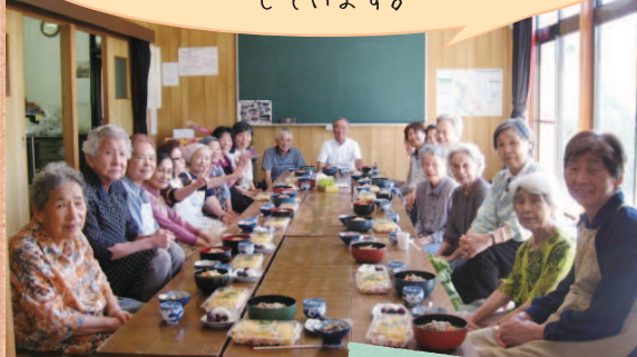
いきいきサロン若葉会 (平第二)

いつもおしゃべりや ビンゴゲームなどで盛り上がっています。 12月にはみんなで、もちつき大会をする予定に しています。