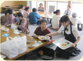
ふれあい・いきいきサロンでは、 食事の配膳も手伝いました