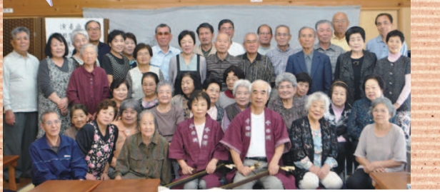
鴨生第二いきいきサロン