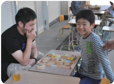
子どもも大人もみんなで一緒に盛り上がったもりのきしょうぎ大会

います。19日(日)、イベント会場では、そば打ちの実演や紙芝居ミニライブのほか、もりのきしょうぎ大会が開催されました。もりのきしょうぎは、杉や檜の間伐材で作られていて、3×4の盤面の中で、てんとう虫やとんぼなどの4つの駒を用いて行います。単純でありながら奥が深く、子どもから大人まで楽しむことができました。小学生5名と大人3名が参加し、優勝を目指して熱戦を繰り広げていました。 閉校となり寂しげに佇 ただす んでいた旧大隈小学校に、久しぶりに子ども達の笑顔が溢れていました。