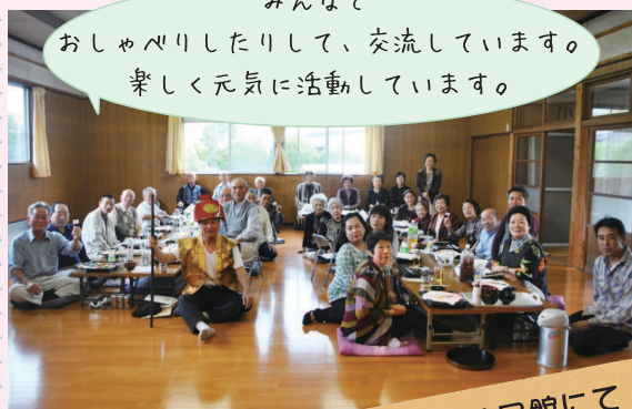
ひだまりサロン (漆生南部)