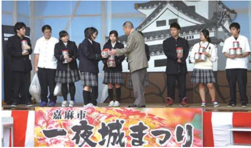
生徒会のみなさんと村上会長