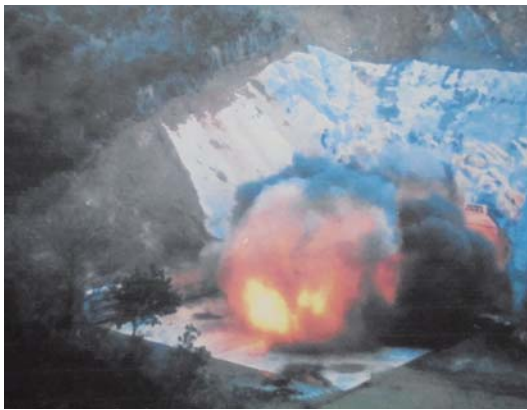
S41.7.17 爆発試験坑道での炭じん爆発実験

坑内では、ガス爆発を起こさないようガスの濃度を下げるため、通気をよくした状態で風を送ります。しかし、その影響で坑内に炭じんが溜まり、舞い上がった炭じんが火源が加わることで爆発が起ると分かっていたそうです。