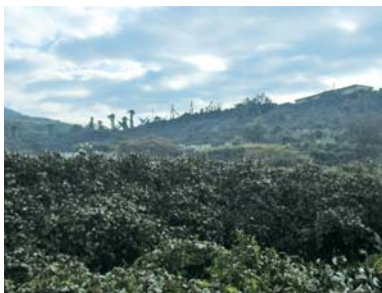
積込場や選炭場の跡地