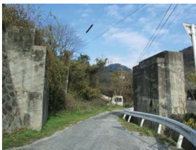
引込線を支えた2つの橋台

炭から石油へと変わり、町並みも変化していき、移りゆく時代の寂しさや儂さを感じました。