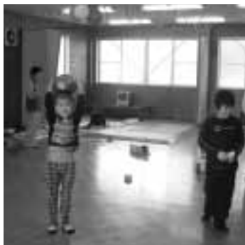
嘉麻北日中一時支援事業所

新入学や進学を控えて、仕事の都合などによって、障がいのあるお子様が学校の放課後や、休日に一人になってしまう、と心配なさっている方もおられるのではないのでしょうか。