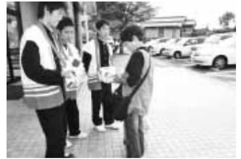
稲築東中学校生徒のみなさん