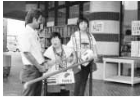
つばさ学園のみなさん