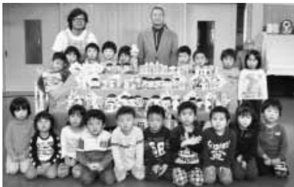
恵大保育園の園児のみなさんから募金をいただきました

職域募金は、市内の事業所や団体等において、募金資材（バッジ・ネクタイピン・クオカード・図書カード・ボールペン）を購入いただくもので、38カ所の事業所等からご購入をいただきました。今年度新たに販売したボールペンは、195本を購入いただきましたが、逆にバッジの購入が低調となりました。また、事業所や保育園、個人