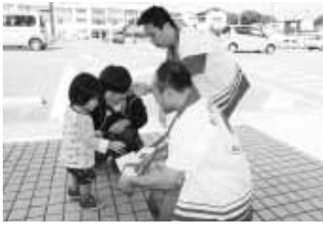
清浄学園のみなさん