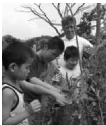
ミニトマトの収穫

平成22年度の主な行事 春 … 畑作り、苗植え 夏 … 収穫祭、交流会 冬 … クリスマス会