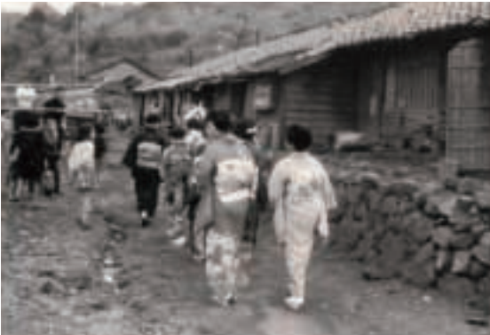
新郎の家に向かう花嫁

当時の花嫁は、挙式を行う前に射手引神社(上山田)まで歩き、お参りをする事が慣わしで、それから式を挙げる新郎の自宅へと向かっていたそうです。左側の写真は、お宮参りを終えて新郎の家に向っている時のもので、左側には、花嫁姿を一目見ようと、近所の方たちが温かく出迎えている様子が写っています。このように当時の結婚式は長屋全体が祝福ムードに包まれ、近所の方を交えた酒宴は夜遅くまで続いたそうです。