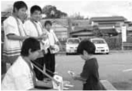
山田中学校生徒のみなさん