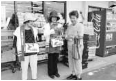
嘉穂ボランティアともしび会のみなさん