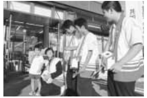
嘉穂中学校生徒のみなさん