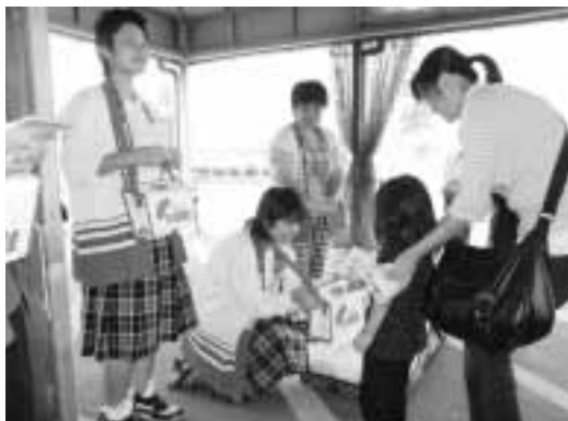
嘉穂総合高校大隈城山校生徒のみなさん

「ハートがつなぐ地域の輪」をキヤッチフレーズに実施した平成22年度の赤い羽根共同募金は、昨年12月末をもって3カ月間の運動を終了いたしました。