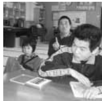
嘉麻南日中一時支援事業所

本会では、学校の放課後や夏休みなどの長期休暇期間を楽しく充実して過ごせるよう、日中一時支援事業を市内2カ所で実施し、現在、小学生から高校生まで約20人の子どもたちが利用しています。ご利用についての詳細をご案内しますので、まずは、お気軽にご相談下さい。事前に事業所を見学することもできます。