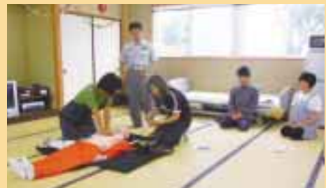
心肺蘇生法を実践中

参加したスタッフは、「基本的な救命処置について改めてしっかりと学ぶことができよかったです」と感想を話し、なにかあった場合には、慌てずに役割分担をすることが大事だということをもみんなで確認しあいました。