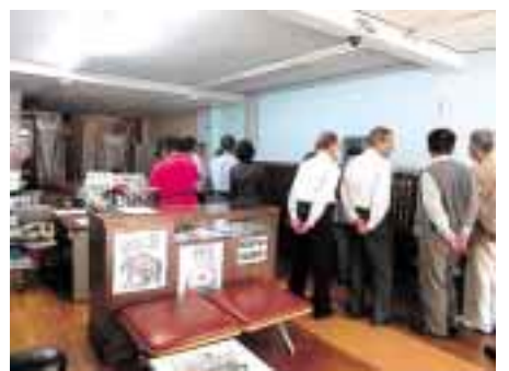
人吉市買い物支援センターを見学

質疑応答の時間では、役員・評議員の方々からも、「どの位の距離を配達しているのか」「登録している男女比はどうなっているのか」「商品はどのようにして注文するのか」「届けた商品が気に入らなかつた場合はどうするのか」など、事業の根幹につながる数多くの質疑も交わされ、大変学ぶことの多い、充実した研修会となりました。