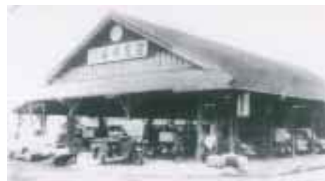
当時、飯田地区を代表した市場「飯塚青果碓井支店」

右の写真は、飯塚青果碓井支店という市場です。現在はいすい中央ストアとしてその姿を変えています。農業をやりながら炭鉱に従事している人が多くいたことから、この市場が建てられたそうで、農産物を取りめる人とそれを買い求める人の往来が一日中絶えなかつたと言います。