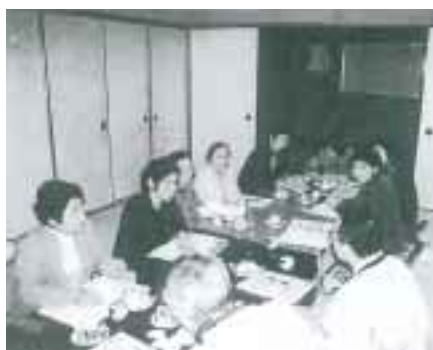
平成13年に開催した学習会の様子

その課題を解決するためには、地域全体で取り組み、関係者のつながりが必要であると考えた当時の地域福祉部が平成13年、行政区にある組織の各代表に呼びかけ、準備委員会を立ち上げ、福祉のネットワーク作りに向けて動き出しました。地域福祉活動の拠点として、当時稲築町社協が推進していたふれあい・いきいきサロンを開設するため、他地区のサロンを見学したり、サロンの内容を協議するなどの学習会を