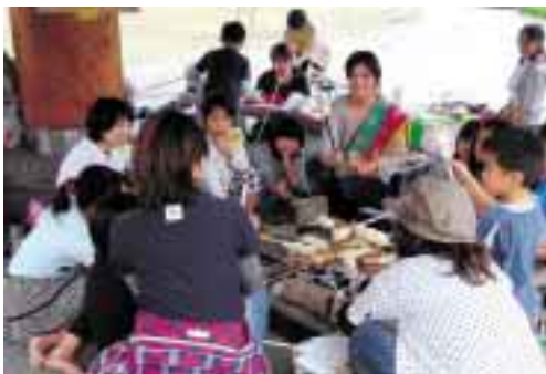
炭火にかざして焼いていきます

秋の爽やかな気候のなか、のびのびと思う存分に汗を流したあとで食べたパンの味は、格別だったようです。