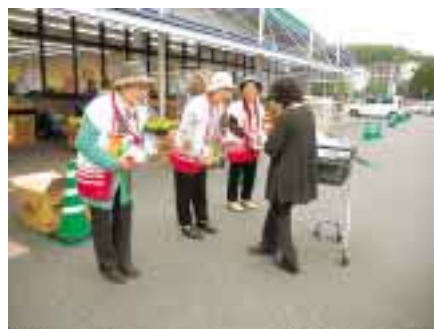
フレッシュ8 稲築店