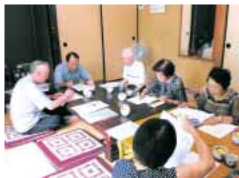
ネットワーク委員会での協議

ふれあいネットワーク委員会では、現在、対象者の拡大をはじめとする、活動のさらなる発展に向けて、検討を行っているっており、地域の方々にもふれあいの輪への参加を呼びかけています。