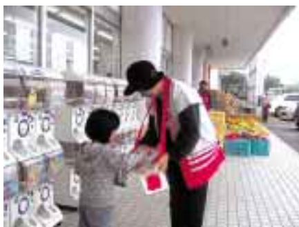
トレードマート 稲築店