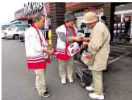
foodway(フードウェイ) 稲築店