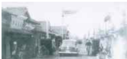
商店が立ち並び、買い物客で賑わつた飯田通り

この通りには、約45軒の商店が軒を並べたほか、碓井館、双葉館、中央館という映画館が3軒もありました。上映以外にも、芝居や舞踊、浪曲などの発表も連日行われており、また、碓井館は、現在の飯田区民センター、双葉館は飯田の駅通り付近、中央館はうすい中央ストア付近と、わずかな距離の間にあつたことから、娯楽の場としてなくてはならない存在であつたように思われます。さらに、酒場も多くあつたこの通りには、夜になると明日の活力を養う炭鉱労働者で深夜まで賑わつたそうです。