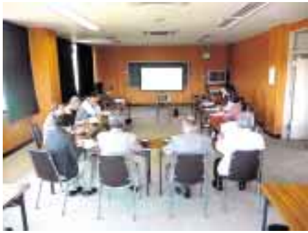
人吉市社協にて事業説明をうける

く残っているため、アーケード街やモール街のような商店などが連なる場所はありません。人口は35,350人、世帯数15,779世帯、高齢化率も30.3%と高く、一人暮らし高齢者等が増える中で、日々の暮らしに直結するニーズも増えていたと言います。