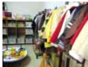
冬の洋服がたくさん並んでいます。