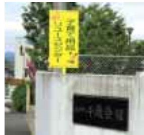
この看板が目印です。

碓井千歳会館にある子育てリユースセンターは、毎月約90名の方が利用し、一旦役目を終えた子育て用品が、必要な方にリユースされています。現在、ベビーベッドやおんぶ紐などを探しているという問い合わせを多くいただいています。ご家庭で眠っているものがあれば、ぜひリユースセンターにお寄せください。また、冬の洋服やおもちゃが充実していますので、お気軽にお立ち寄りください。お待ちしております。