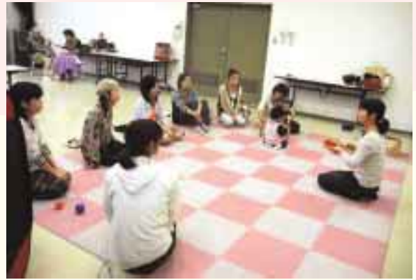
質問や悩みを自由に話しました

生後約3ヵ月から1歳の子どもも一緒に参加し、温かい雰囲気の中で学ぶことができた講座となりました。