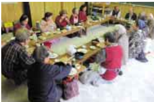
みんなで楽しく味わいます

この日は、始まる前から女性が5、6人集まり、自由におしゃべりを楽しんでおられ、「家に一人だと寂しいけど、ここに来るとこうして友達と話ができるので嬉しい」と心待ちにしている気持ちを話されます。その後、16人が参加し、食事の時間は、野菜たっぷりのお味噌汁やかしわご飯を味わいました。参加者のなかには一人暮らしの方も多いため、栄養面にも気を遣っていて、「みんなで食べるご飯はやっぱり美味しいね。」と、笑顔が溢れます。食事の後には毎回恒例のビンゴゲームで盛り上がり、「リーチ!」「ビンゴ!」と元気な声が会場を包んでいました。