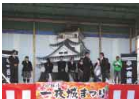
約110kgのリングブルが手渡されました