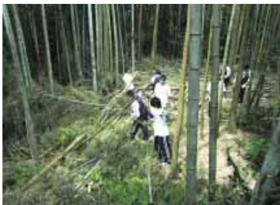
長くのびた竹を伐採