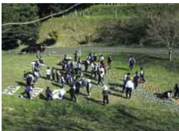
今年の一夜城まつりのキャンドルアートの準備