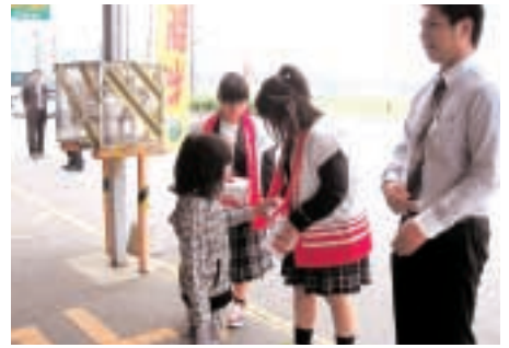
嘉穂総合高校大隈城山校生徒有志のみなさん (カッホー馬古屏にて)