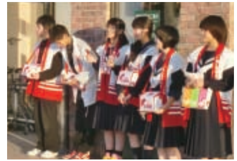
稲築東中学校生徒有志のみなさん (スーパーASO稲築店にて)