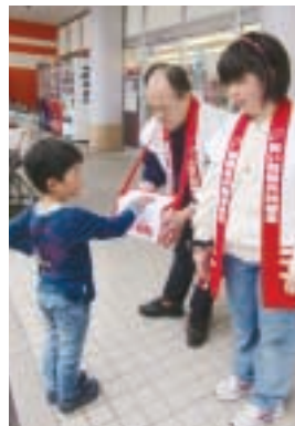
清浄学園のみなさん