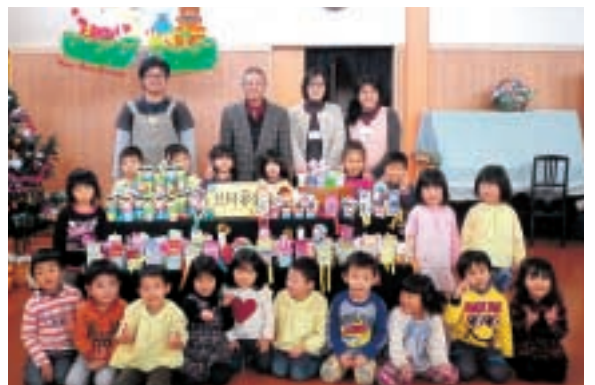
恵大保育園の園児のみなさんからも募金をいただきました。