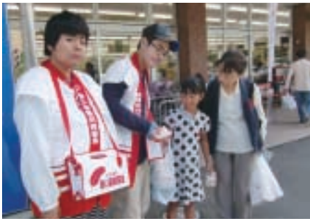
筑豊学園のみなさん (スーパー川食山田店にて)