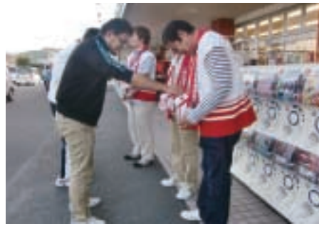
ハートフルボイス自立支援センターうすいのみなさん (スーパー川食碓井店にて)