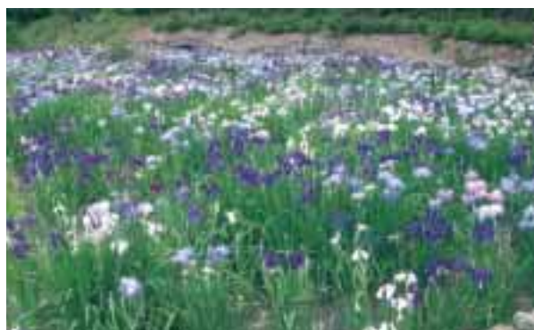
昨年の満開時の様子

ることを伺い、水害の1か月前の満開の写真を見せてもらいました。今年の6月中旬にはきれいな花が咲くので、また是非見に来てくださいなと声をかけていただきました。地域の