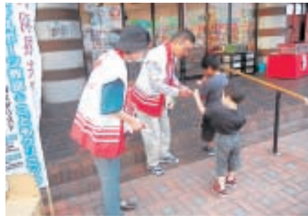
碓井地区民生委員児童委員のみなさん (道の駅うすいにて)