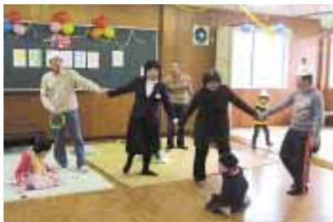
みんなでクリスマスソングを歌いました。

平成24年12月21日(金)、嘉麻北日中一時支援事業所でクリスマス会を開催しました。当日は、北事業所と南事業所を利用する子どもたち17名が参加し、いつも以上に賑やかでした。スタッフ手作りの「日中愛情弁当」を食べた後は、ボランティアグループ福寿草のみなさんによる絵本