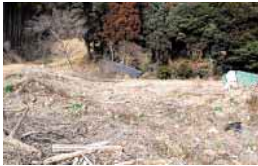
土砂で埋めつくされた田んぼ

ることを伺い、水害の1か月前の満開の写真を見せてもらいました。今年の6月中旬にはきれいな花が咲くので、また是非見に来てくださいなと声をかけていただきました。地域の