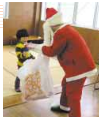
サンタさん、プレゼントありがとう

サンタクロースの登場に、泣き出してしまう子どももいましたが、プレゼントをもらおうと、みんなとびきりの笑顔で喜んでいました。参加した子どもたちは、なかなか会うことがない他の事業所の友達やボランティアのみなさんと交流することができ、楽しいクリスマスを過ごしました。