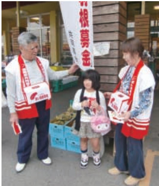
稲築地区福祉推進委員のみなさん

人募金は、市内・市外の事業所や商店など、252カ所からご協力をいただきました。あらたに17カ所から協力を得られたことで、昨年度より1.5%増(17,000円)となりましたが、反面、廃業となったり、経営難で協力を断られた事業所等も8カ所ありました。