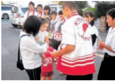
嘉穂中学校生徒有志のみなさん (スーパーASO大隈店にて)