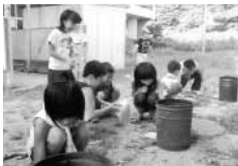
火をおこす子どもたち(今年のキャンプの様子)

家へ帰りますが、3年生は、テントを張り泊まります。初めて、お父さんやお母さんと離れて泊まる不安や寂しさを隠しきれない子、お友達と一緒に一晩過ごすことが嬉しくてしかたない子、不慣れなナイフを使い、けがをしないようにと一生懸命じゃがいもや人参、玉ねぎの皮をむいたり切ったりする子どもたち。キャンプや長い夏休みが終わる頃には、ちよっと成長した子どもたちの姿が見られることと思います。