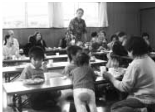
子どもも高齢者も共に楽しむクリスマス会