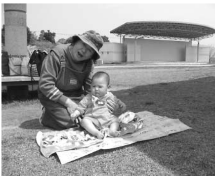
ぼかぼか陽気に誘われて

これからもこのサロンが、お母さん同士のつながりを深め、また地域の先輩ママからのアドバイスをもらえるような場になればと思つていますので、一度遊びにきてみませんか? 参加される方は、開催日時が変更になることもありまので、事前にお問い合わせください。