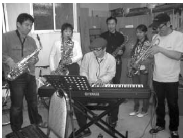
迫力のある練習風景

なお、本会の会員に関するお問い合わせ、加入のお申し込みは、本会事務局までお願いいたします。