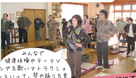
山野第一ふれあいきいきサロン

みんなで 健康体操やテーマソ ングを歌いアトラクショ ンといって、琴や踊りを見 て聴いて楽しく元気に活 動しています。