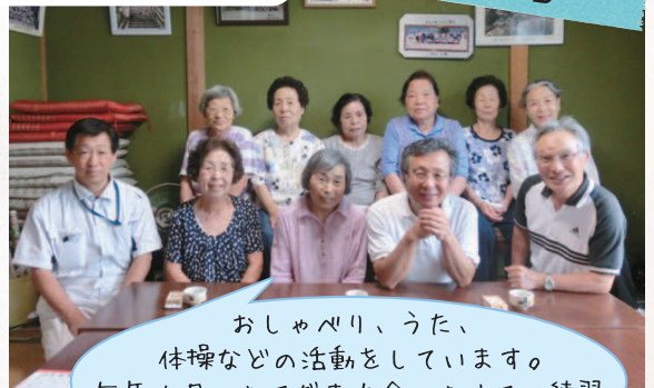
中籠公民館にて 毎月5日

おしゃべり、うた、 体操などの活動をしています。 毎年6月のおてだま大会にむけての練習 にも力を入れています。