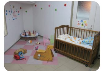
おもちゃで遊ぶこともでき、ゆっくり過ごせます。

また、センターの一角にマットスペースとベビーベッドを設置いたしましたので、お子さんの休憩や、おむつ交換などにご利用ください。