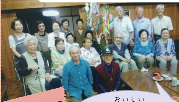
銭代坊公民館にて 第4日曜日

おいしい 食事をして、カラオケや おどりをしています。みんなで おしゃべりして、笑顔いっぱい のサロンです。