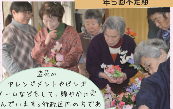
鴨生北町公民館にて 年5回不定期

造花の アレンジメントやビンゴ ゲームなどをして、賑やかに楽 shinでいます。行政区内の方であ ればどなたでも参加可能です。 一緒に楽しい時間を過すし ましよう。