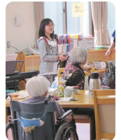
初日に、緊張しながら自己紹介をする奥さん

A. もっとみなさんとコミュニケーションをとれるようになりたいです。夢は、高齢者と関わることができる福祉の仕事に就くことなので、これから勉強に、ボランティア活動に頑張りたいと思います。