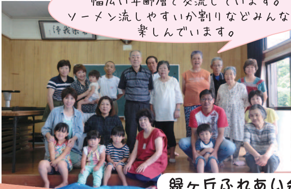
緑ヶ丘ふれあい会 緑ヶ丘公民館にて 第1日曜日・第3土曜日

子どもから大人まで 幅広い年齢層で交流しています。 ソーマン流しやすいか割りなどみんなで 楽しんでいます。