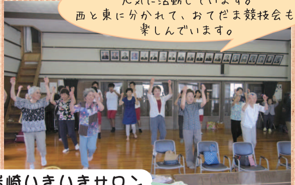
岩崎いきいきサロン 岩崎公民館にて 毎週土曜日

歌やおどりをして 元気に活動しています。 西と東に分かれて、おてだま競技会も 楽しんでいます。