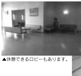
▲休憩できるロビーもあります。