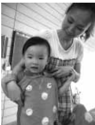
綺麗な水玉のTシャツが出来上がり

世界に一つだけのTシャツが出来上がり、みんなの笑顔が溢れるおしゃべりサロンとなりました。