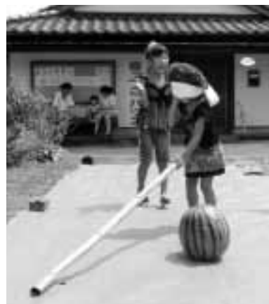
昨年の交流会(スイカ割り)の様子