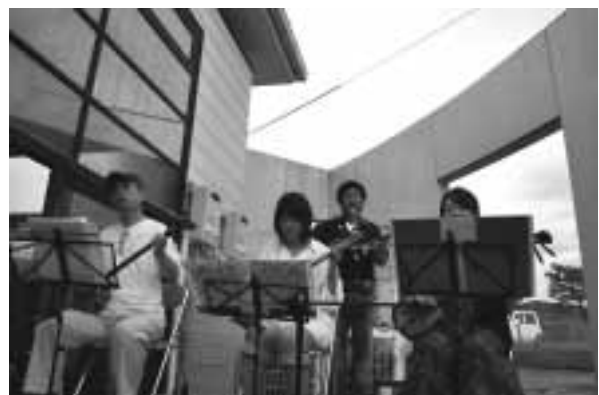
ちくほう三線友の会のみなさんによる演奏