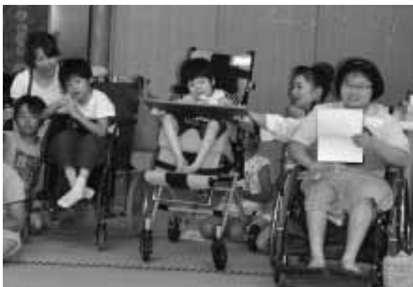
みんなで楽しく演奏会

8月6日(土)、山田ふれあいハウスで、障がい児日中一時支援事業の交流会を開催しました。この交流会は、子どもたちの夏休みの思い出づくりと保護者同士が交流できるよう毎年開催しているもので、今年は40名の参加がありました。