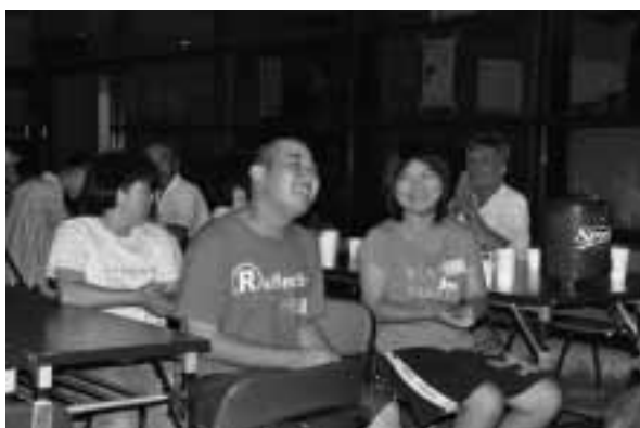
琉球三線のやさしい音楽に笑みがこぼれる

今回は、手作り楽器による演奏会を行いました。子どもたちは、ペットボトルや紙コップで作った楽器を手に、大きな声で熱唱したり、ダンスや手話が飛び出すなど、会場は大変盛り上がり、保護者の方々も子どもたちの笑顔に目を細めていました。この他、ちくほう三線友の会による琉球三線の演奏や食事会などもあり、あつという間に時間が過ぎていきました。今回初めて交流会に参加した保護者の方からは、「たくさんの方とお話することができました。子どもにとっても、夏休みの思い出ができて、良かったです。」との感想が聞かれました。