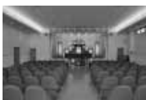
▲最大200名程度収容可能なセレモニーホールです。