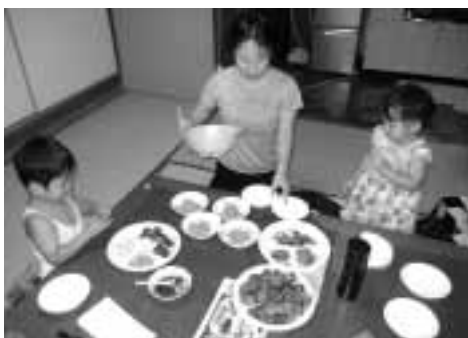
レシピにそって、料理づくりの様子