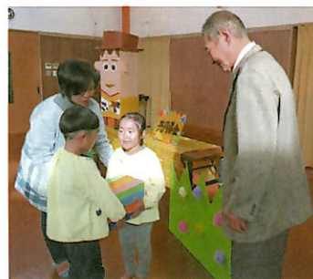
嘉麻市支会だより①