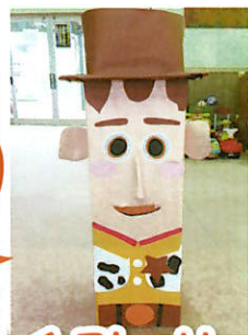
手作りのトイ・ストーリー ウッディの貯金箱