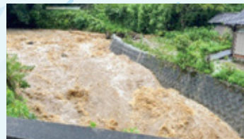
桑野行政区の遠賀川の様子