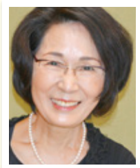
兵庫県西宮市在住