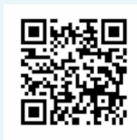
福岡県社協災害救援情報のページはこちら

今回の大雨で、福岡県内の6市町村(久留米市、朝倉市、うきは市、那珂川市、広川町、東峰村)では、7月中旬以降、災害ボランティアセンターが逐次開設されています。災害ボランティアの受付条件もセンターごとに異なりますので、詳しくは福岡県社協ホームページの災害救援情報をご覧ください。