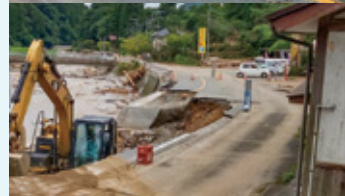
寸断された東峰村の国道211号