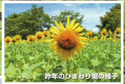
昨年のひまわり畑の様子