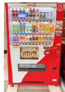
軽費老人ホーム稲穂園