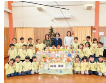
大隈城山校 PTAのみなさん