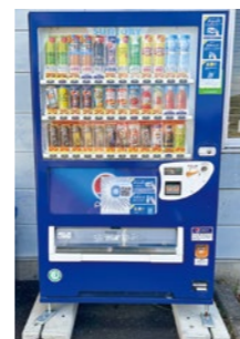
山田ふれあいハウス