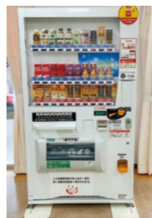
社会福祉法人翼つばさ学園

市内3か所に設置している自動販売機の売上げの一部99,665円が寄附されました。