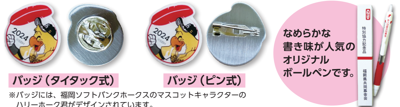
バッジ (タイタック式)

※バッジには、福岡ソフトバンクホークスのマスコットキャラクターのハリーホーク君がデザインされています。