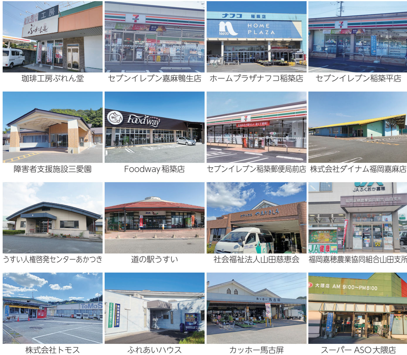
珈琲工房ぶれん堂 セブンイレブン嘉麻鴨生店 ホームプラザナフコ稲築店 セブンイレブン稲築平店 障害者支援施設三愛園 Foodway 稲築店 セブンイレブン稲築郵便局前店 株式会社ダイナム福岡嘉麻店 うすい人権啓発センターあかつき 道の駅うすい 社会福祉法人山田慈恵会 福岡嘉穂農業協同組合山田支所 株式会社トモス ふれあいハウス カッホー馬古屏 スーパー ASO大隈店