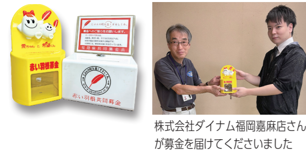
株式会社ダイナム福岡嘉麻店さんが募金を届けてくださいました

キャラクター募金箱設置協力店を募集中 店頭や会社の受付などにキャラクター募金箱を設置していただける協力店等を募集しています。ご協力をいただける場合は、下記までご連絡ください。