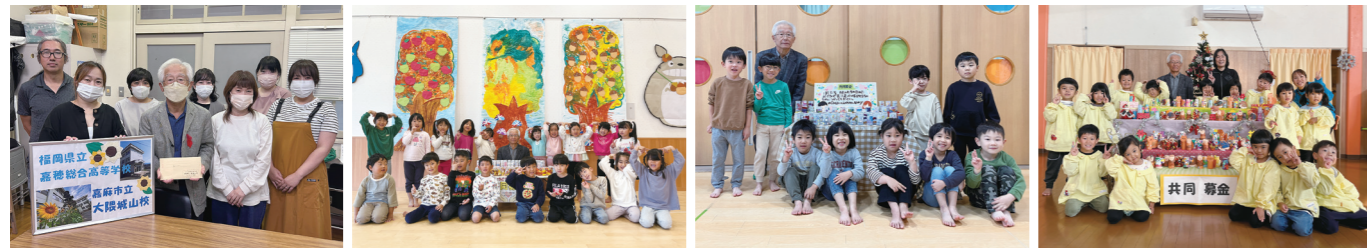
大隈城山校PTAのみなさん 山野保育園のみなさん めぐみ保育園のみなさん 恵大保育園のみなさん